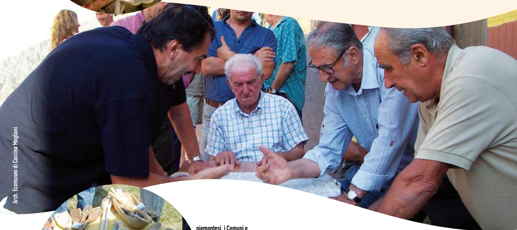
Arch. Ecomuseo di Cascina Moglioni

Sul fronte della tutela e della valorizzazione della memoria storica, l'Ecomuseo ha portato a termine e pubblicato il volume Capanne di Marcarolo dell'Atlante Toponomastico del Piemonte Montano, una collana, diretta