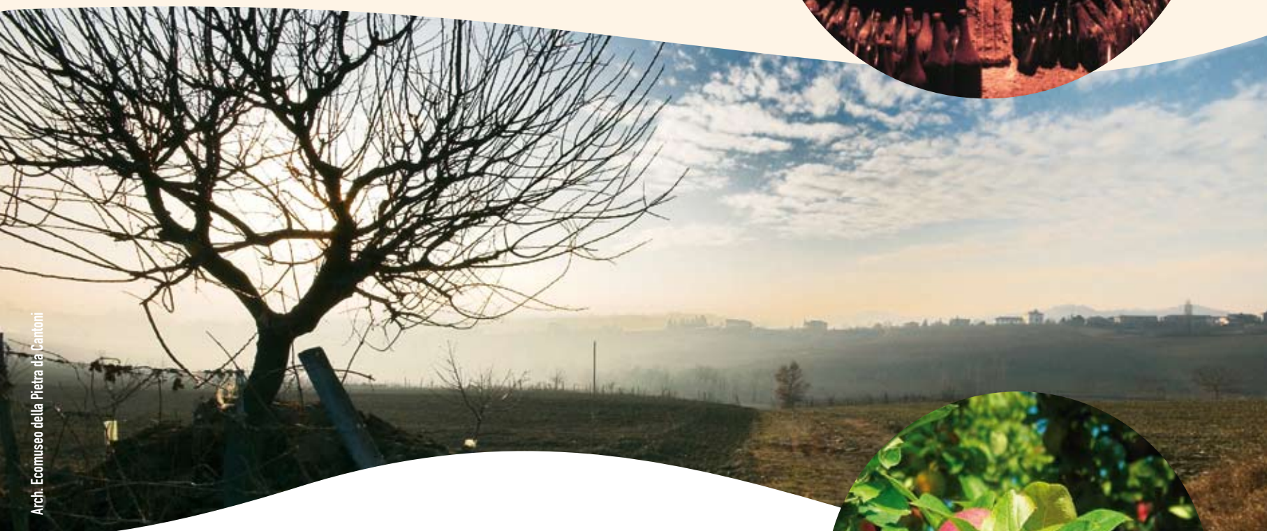
Arch. Ecomuseo della Pietra da Cantoni