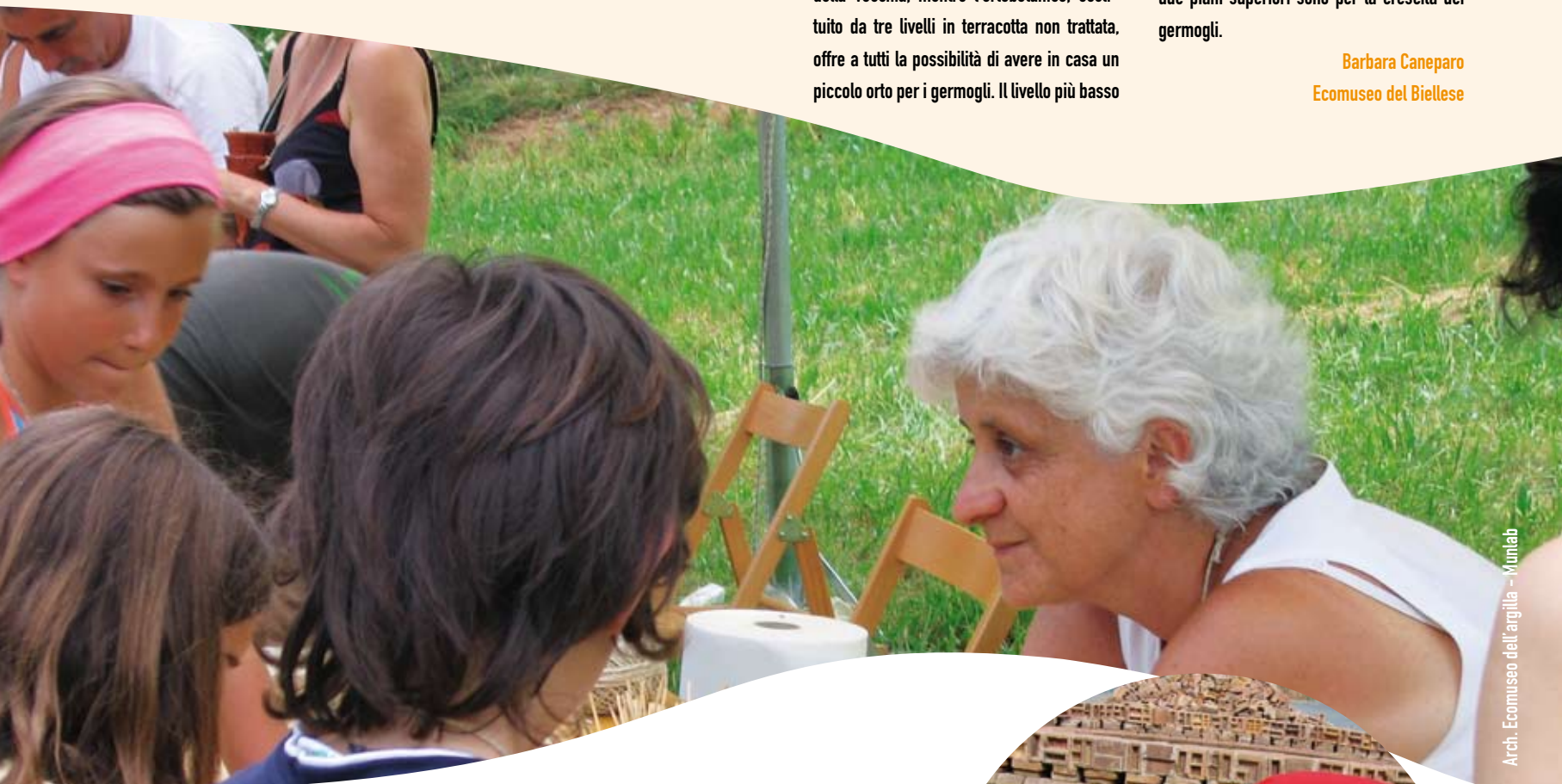
Arch. Ecomuseo dell'argilla - Munlab