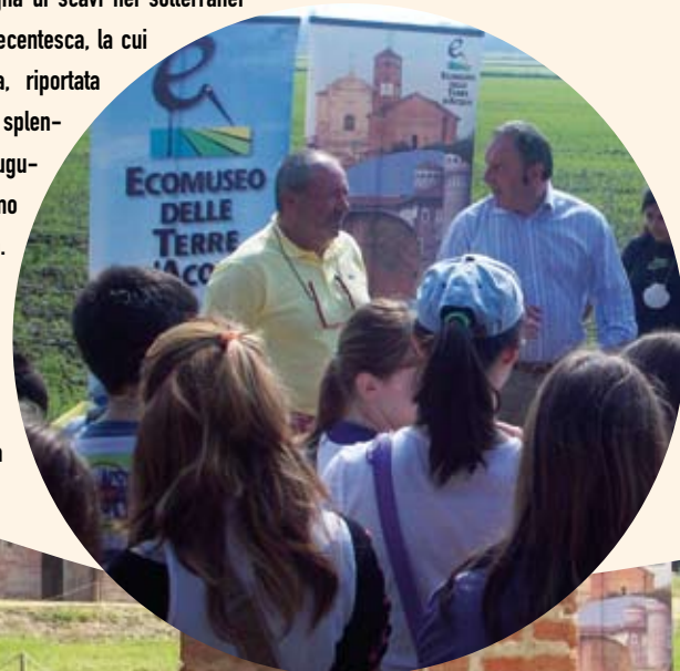
Arch. Ecomuseo delle Terre d'Acqua