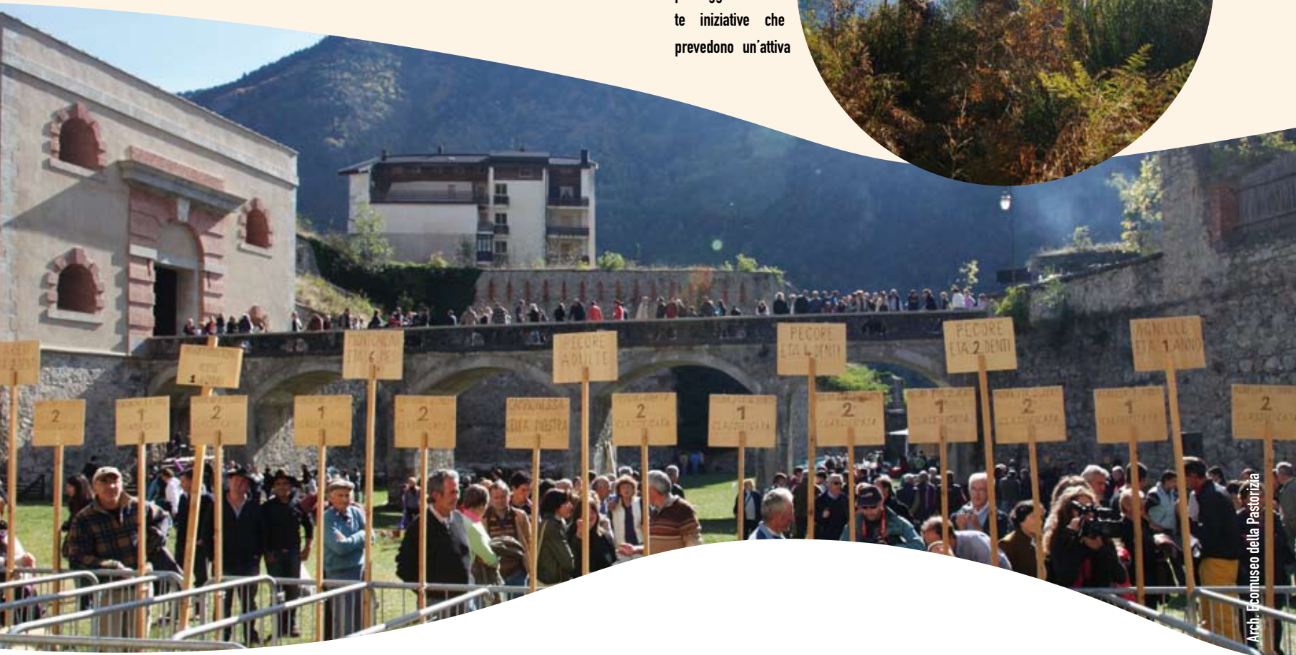
Arch. Ecomuseo della Pastorizia